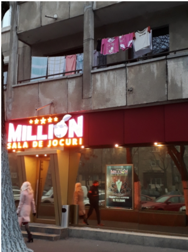
The Game of Life

Die Kunst der Improvisation hat hier Mini-Gewächshäuser aus gebrauchten Wasserflaschen aus dem Stegreif hervorgebracht. In Deutschland und anderswo wäre diese Interpretation der zugetanen Gärtner:innen wohl Guerilla-Nachhaltigkeit - hier ist es notwendiger Pragmatismus mit modernen Mitteln. Die Stecklinge indes, denen die Motive gleich sind, dürften mittlerweile wieder in Plastik eingerüstet sein und auf den nächsten Schnee warten.